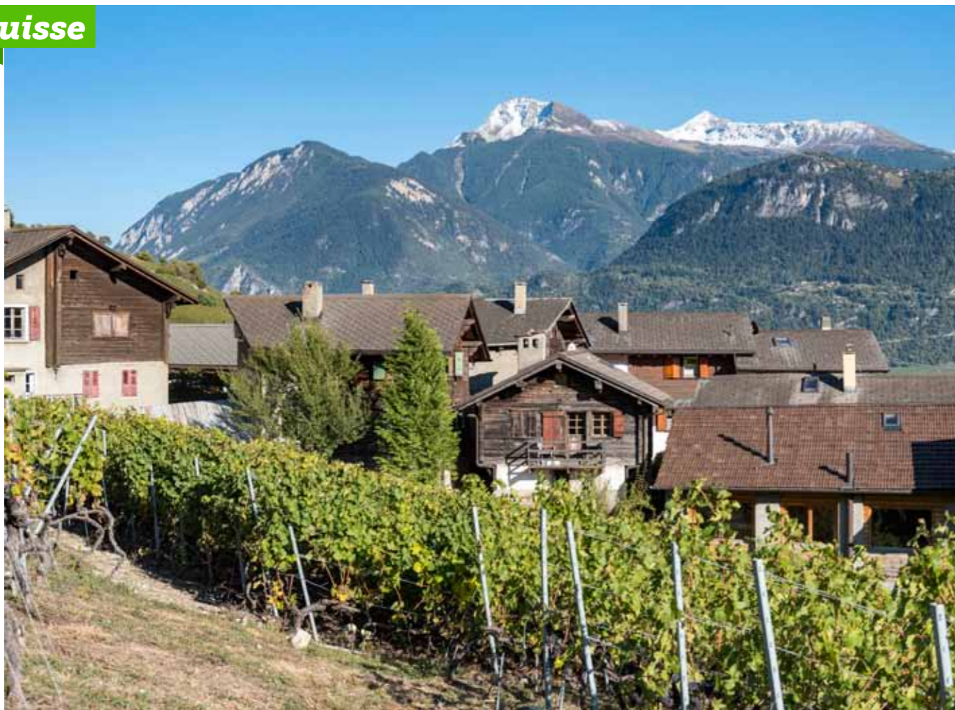
Le hameau de Saint-Clément, situé à 600 m d'altitude et niché au cœur des vignes, est l'un des neuf villages de la commune de Lens.

→ sans orchestre, c'est ennuyeux, alors les plus jeunes en forment un nouveau. Lorsque les musiciens de la première fanfare reviennent, ils reprennent leurs instruments et leur fanfare. Un village avec deux fanfares n'est pas concevable, mais aucune ne veut se saborder. Elles se livrent donc à une compétition féroce