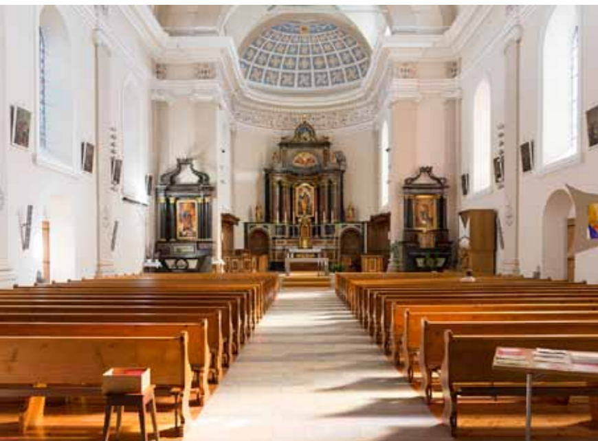
L'actuelle église de Lens, construite 1843-45, a connu depuis deux restaurations, une en 1907 et la dernière en 1975-76. Son intérieur est d'une grande unité et d'une sobriété respectée par les restaurateurs.

qui va semer la zizanie. D'un côté, il y a les « blancs », qui soutiennent la fanfare aux instruments argentés, l'ancienne Cécilia, et de l'autre les « jaunes », qui défendent celle aux instruments dorés, la Cécilia. Le village se divise en deux clans, deux partis de famille... donc deux épiceries, deux banques, deux cafés. « Mes parents étaient "blancs", donc il n'était pas question d'aller à l'anniversaire d'un "jaune" », se souvient cet habitant. « De même, un "jaune" ou un "blanc" qui faisait des affaires avec l'autre clan était vu comme un traître, il devait changer de camp! » Depuis quelques années, cette rivalité s'estompe mais elle ne fut pas stérile. En se tirant la bourre, les musiciens de Chermignon ont atteint un très haut niveau: le Valaisia Brass Band – dont le directeur et la majorité des musiciens sont issus de l'ancienne Cécilia et de la Cécilia – rafle presque tous les titres nationaux et internationaux. Après un siècle, les deux fanfares ont enfin trouvé leur place ici, comme les vignes et les randonneurs. ●